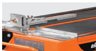
ŘEZACÍ VODÍTKO JE SOUČÁSTÍ DODÁVKY