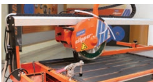
VÝŠKOVĚ NASTAVITELNÁ ŘEZNÁ HLAVA